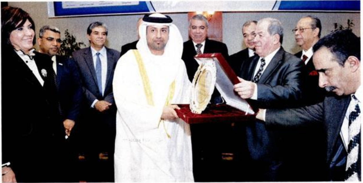
خلال تسليم الجائزة للهيئة