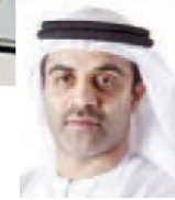
درايل مكلو وتشان