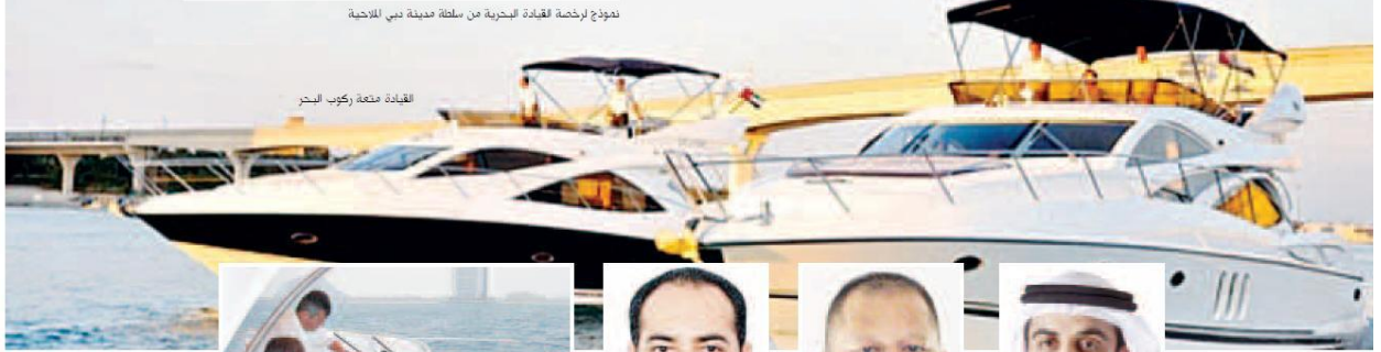
القيادة متعة ركوب البحر