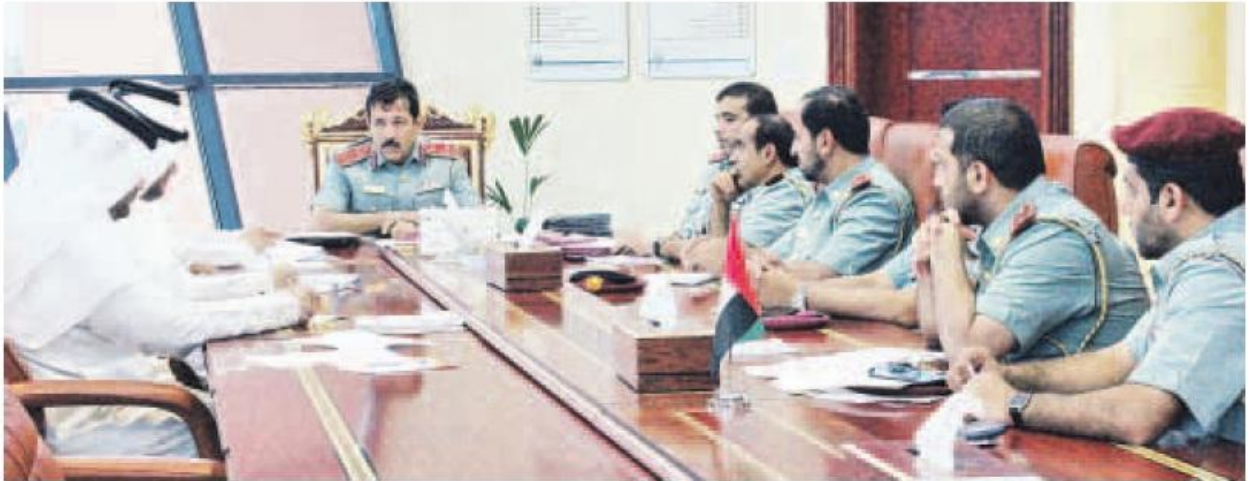
شرطة عجمان تستقبل وفد الهوية